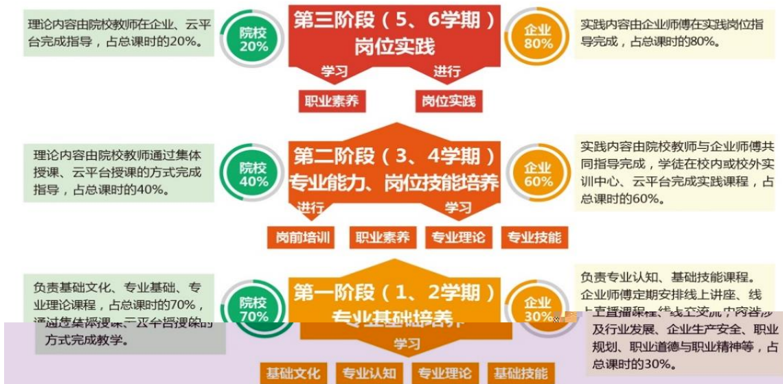
图 4 常州信息职业技术学院动漫制作技术专业课程体系