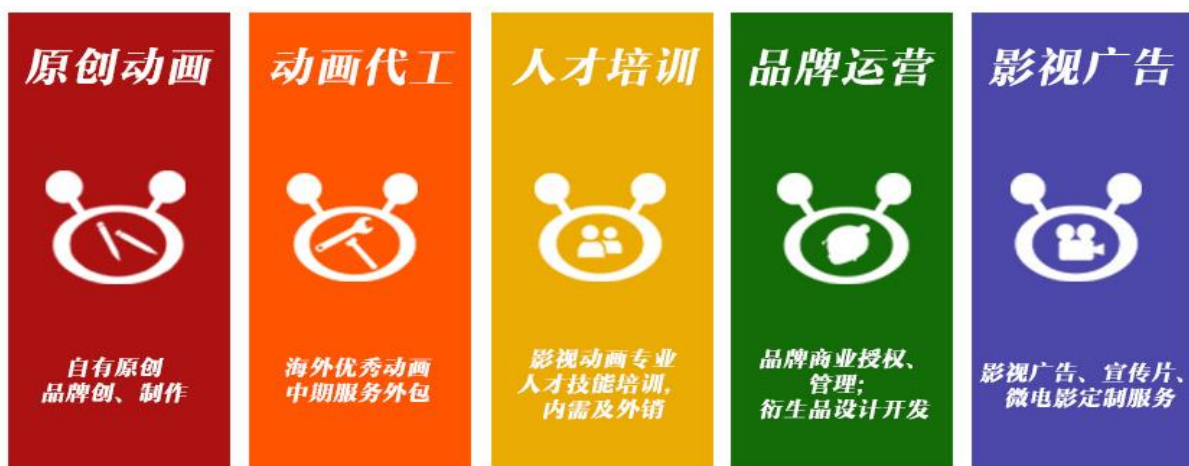
图1 “智海动漫”涉及制作范围

20 年，公司 了 企业 化 “ ”， “ ” 及 及，“ ” 决 ，“ ” 以 品 ， 务回 信任，“ ” 各 不 以 取 优 创作及制作人 。 一句 “ 只 ， 不 只 ”，充 分 了 品 与 务 不 。 不 努力及 ， 出 “ 动 ” 品 。